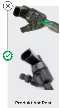
Produkt hat Rost

Um mögliche Umweltverschmutzung zu vermeiden, stellen Sie bitte sicher, dass alle benutzten Gehäuse ohne Risse bzw. ohne äußerliche Beschädigungen in der Originalverpackung verpackt übergeben werden.